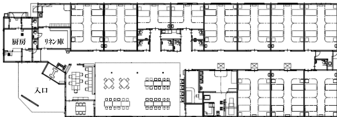
食堂・機能訓練室